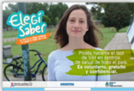
BANNER PARA LA VÍA PÚBLICA