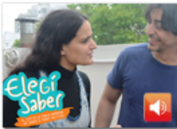
SPOT DE RADIO a "Miramón" (mp3)