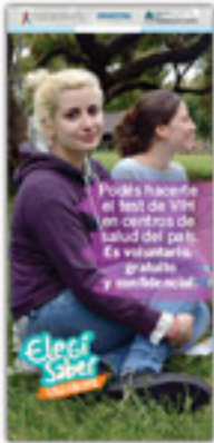
BANNER PARA ESTRUCTURA CON PIE