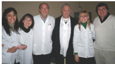
Oliva Saludable, msaloliva@gmail.com , tel: 03532 420100

En el transcurso del año 2009 el Centro de Estudios Audiológicos atendió a un total de 355 personas en los diferentes programas especificados anteriormente.