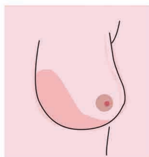
Cambios o sangrado en el pezón

Todas las mujeres deben consultar con su médico sobre los controles de salud más apropiados para su edad.