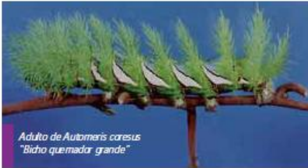
Adulto de Automeris caryoceros "Bicho quemador grande"

http://inta.gob.ar/documentos/lepidopteros.-insectos-perjudiciales-de-importancia-agronomica/at_multi_download/file/INTA_Lepidopteros.