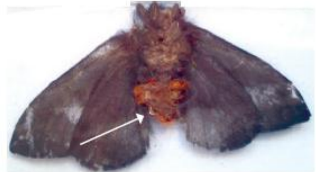
Ejemplar adulto de Hylesia nigricans . Se muestran (flecha) los pelos urticantes en el abdomen ( Arch Argent Pediatr 2014; 112(2): 179-182).