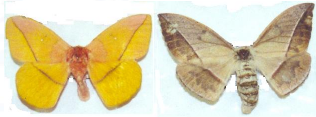
Macho (izquierda) y Hembra (derecha) adultos de Lonomia obliqua . Con las alas desplegadas miden aproximadamente entre 5 y 7 cm.