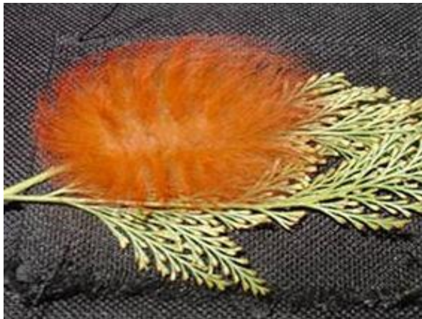
Oruga de Megalopyge .

http://inta.gob.ar/documentos/lepidopteros.-insectos-perjudiciales-de-importancia-agronomica/at_multi_download/file/INTA_Lepidopteros.