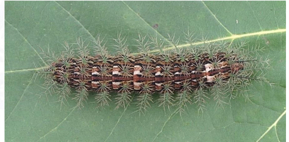
Larva de Lonomia obliqua . Miden aproximadamente 4-5 cm.