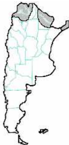
MAPA n° 11 Tityus confluens