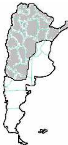
MAPA n° 2 Bothrops neuwiedi diporus Yarará chica