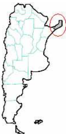
MAPA n° 7 Micrurus altirostris , Micrurus corallinus