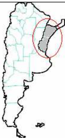
MAPA n° 5 Micrurus balyocorhiphus