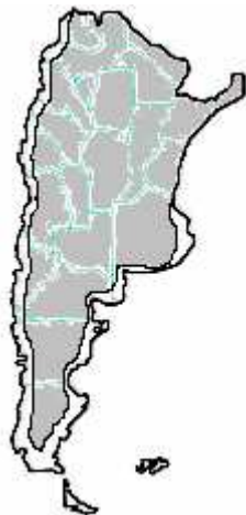
MAPA n° 9 Loxosceles laeta y Latrodectus